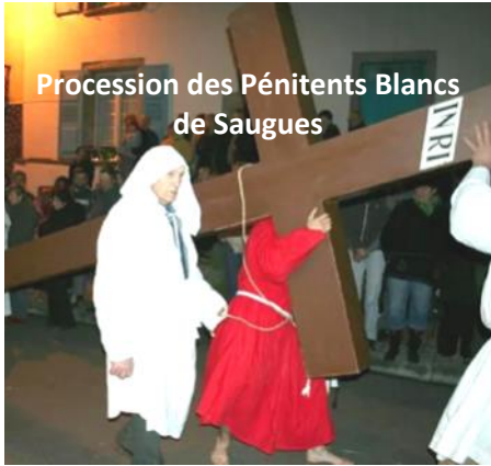
Procession des Pénitents Blancs de Saugues

Ce Vendredi Saint 18 avril à 20h45 rendez-vous devant l'église de Marvejols. La Confrérie ND de la Carce, la Sororité les filles de Marie, les Pénitents Blancs de Saugues (que nous avons invités) , les enfants du catéchisme et toutes les personnes qui veulent participer, nous serons tous présents pour vivre cette grande procession du CHEMIN de CROIX aux flambeaux, dans les rues de Marvejols.