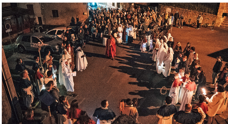
▲ Pendant la procession.

À 21 h précises, le cortège s'est mis en marche, ouvert par un membre de la confrérie portant une grande croix voilée dans une solennité recueillie. Derrière elle, s'alignaient les Confrères en habits traditionnels, la Sororité, les servants d'autel portant lanternes et instruments de